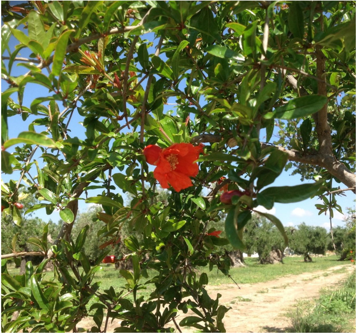
Fiore di Melograno