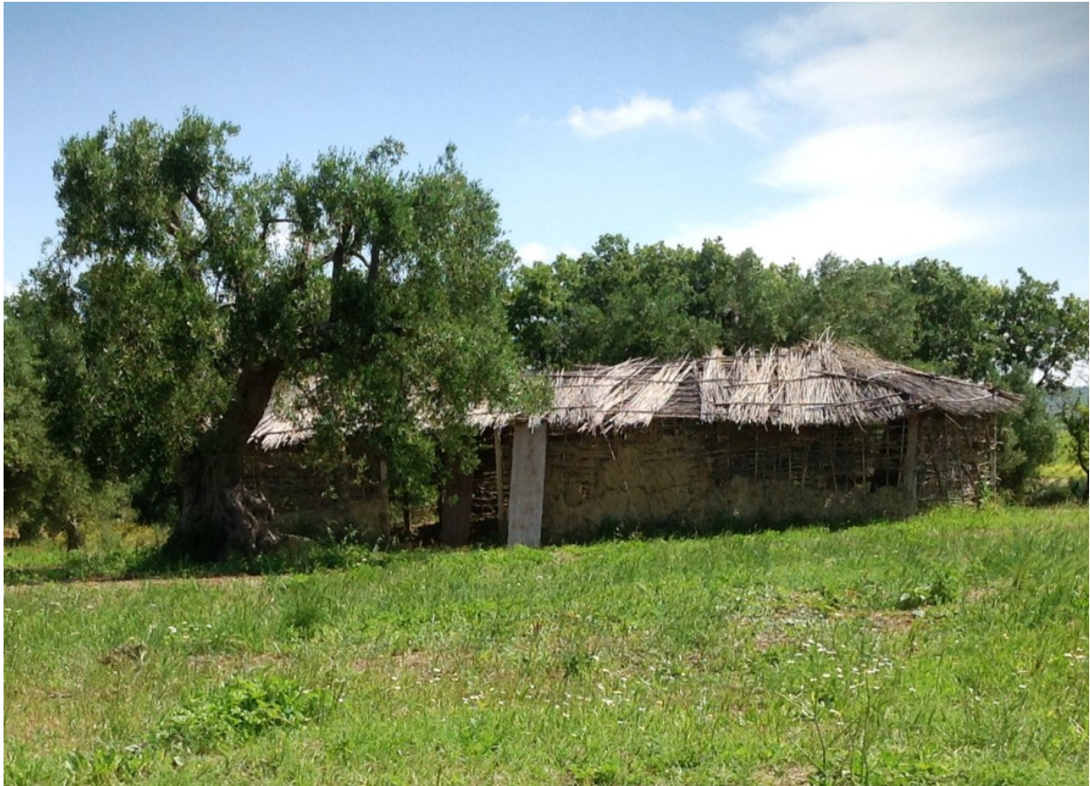
Casa di Paglia

passa attraverso un azione sinergica tra università, professionisti e altre imprese.