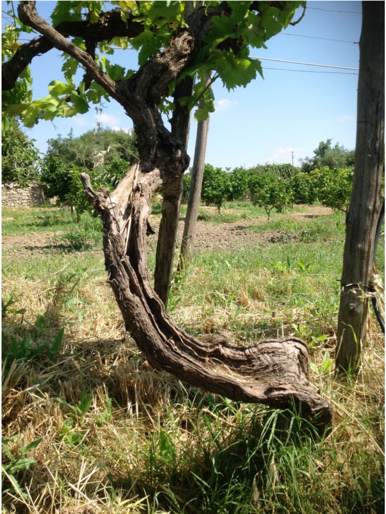
Una vite di cento anni. Monumenti della natura.

ahimè dolente, che purtroppo sento ribattere ogni qualvolta io visiti una realtà agricola.