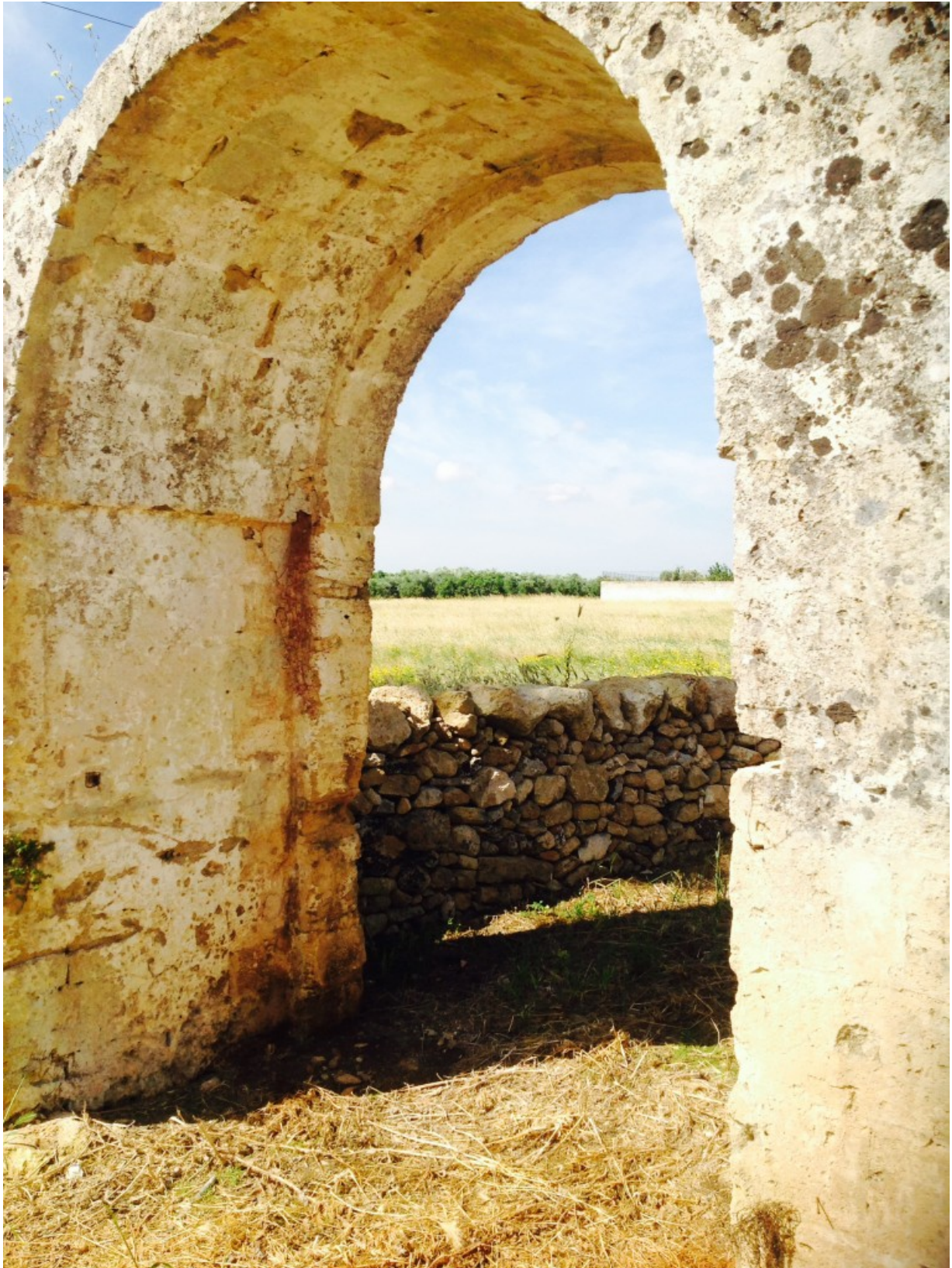
Le Grotte di Sileno – Porta antica