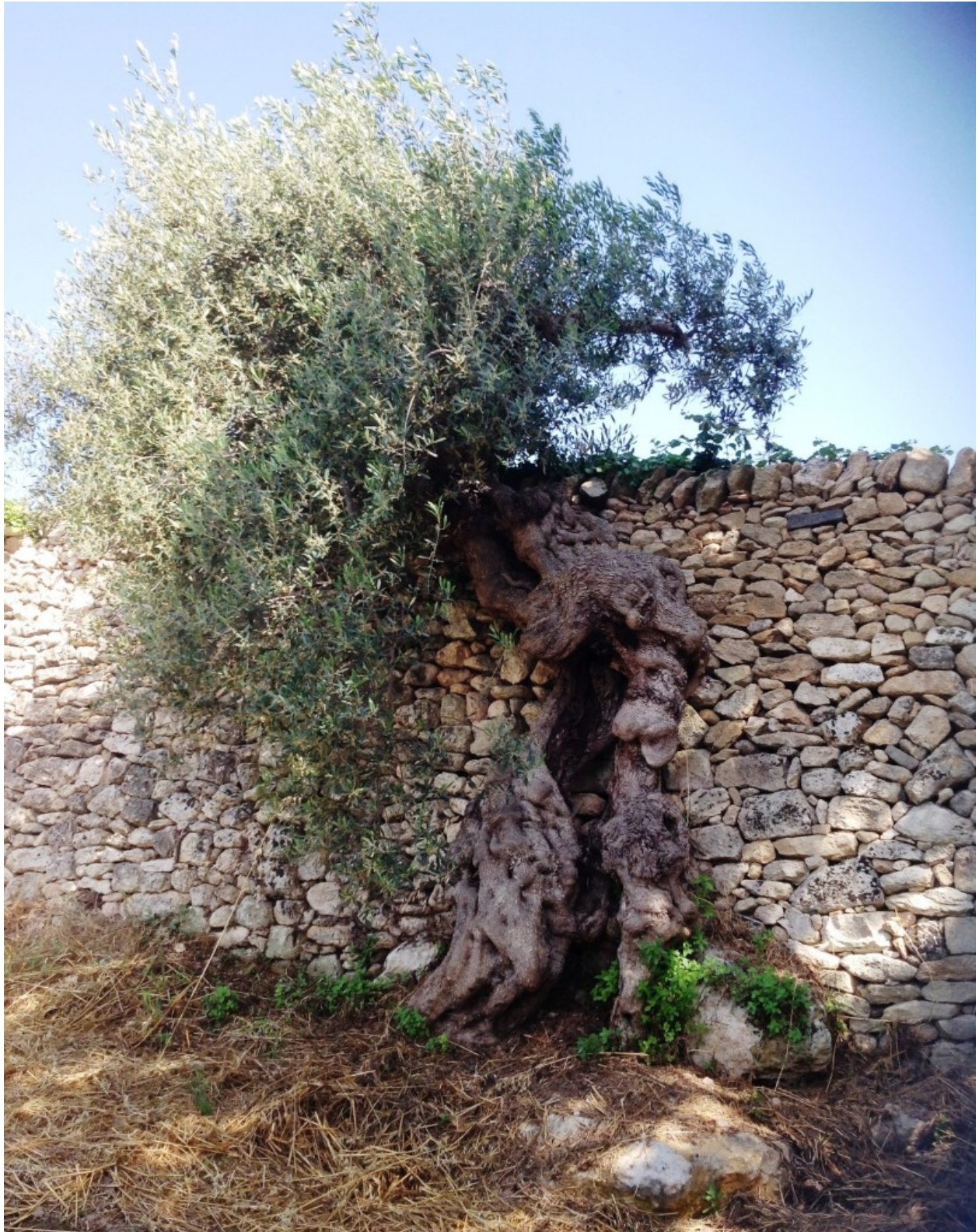
L'ulivo maritato con la pietra