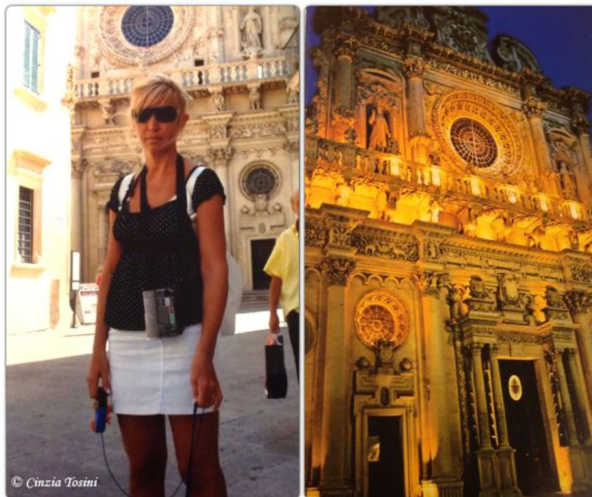
Basilica di Santa Croce di Lecce

zona chiamata "leccisu". Le cave da cui si estrae si trovano nella parte meridionale della penisola salentina, sul versante adriatico. Con questa pietra sono state fatte facciate di chiese, cupole, pavimenti e molto altro.