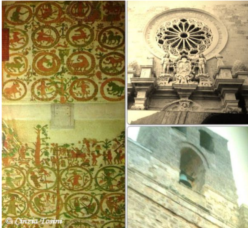
Cattedrale di Otranto

Ecco l'ingresso della Grotta Zinzulusa, a Castro, in provincia di Lecce. Il suo nome deriva da "zinzuli" che in dialetto Salentino significa "stracci appesi". Gli è stato attribuito per le formazioni calcaree che pendono dal soffitto come stracci appesi.