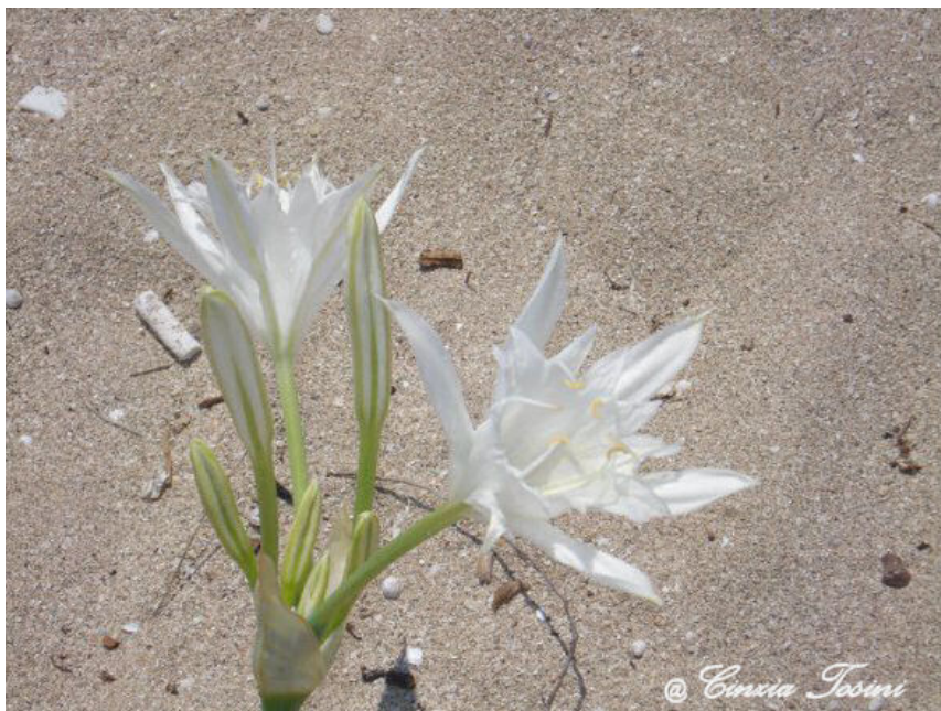
Fiore del Salento

Questo fiore nella sabbia che ho fotografato a Gallipoli è una delle 1390 specie diverse di piante da fiori del Salento.