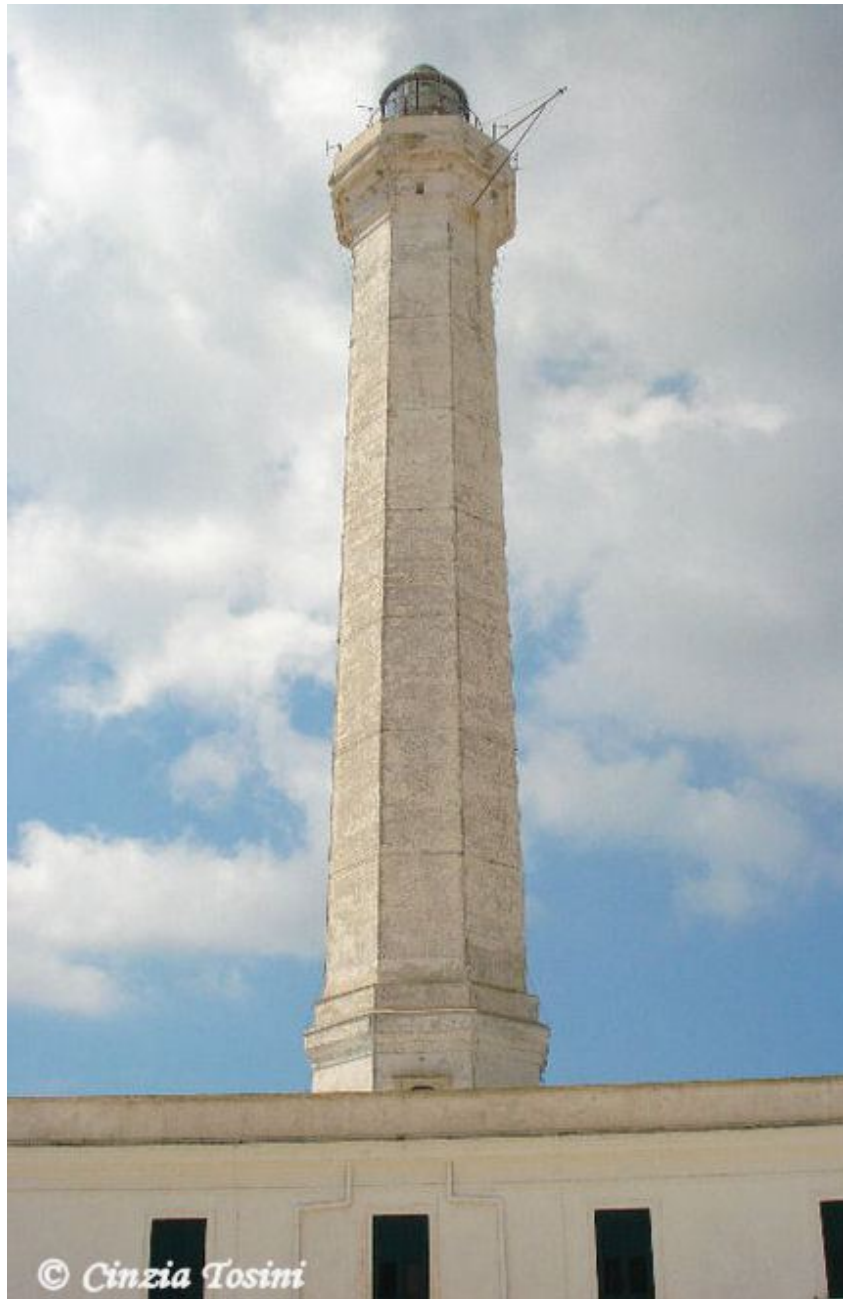
Faro di Santa Maria di Leuca

Non basta una, due, tre volte per vedere tutte le bellezze del Salento... terra da vivere e da rivivere.