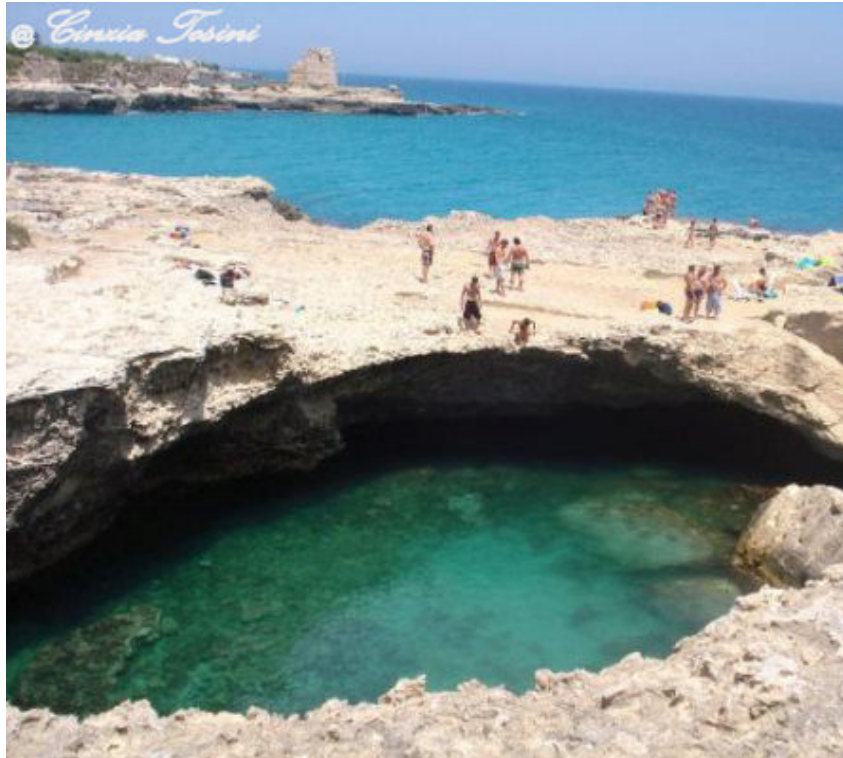
Grotta della poesia

Questo fiore nella sabbia che ho fotografato a Gallipoli è una delle 1390 specie diverse di piante da fiori del Salento.