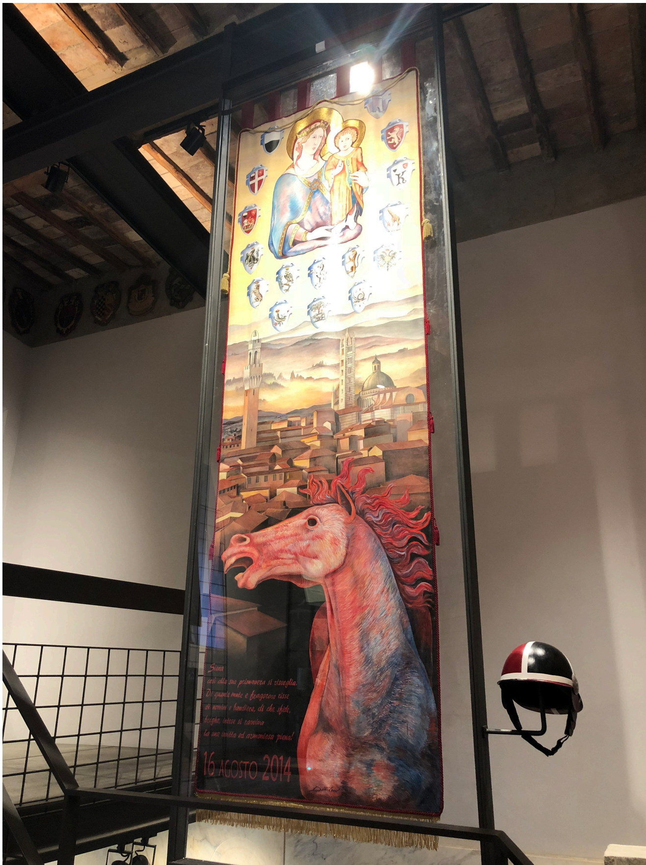
Museo Contrada della Civetta

Siena, un capolavoro dopo l'altro... Questa volta mi riferisco alla Ribollita . Un piatto tipico che si può assaggiare in una