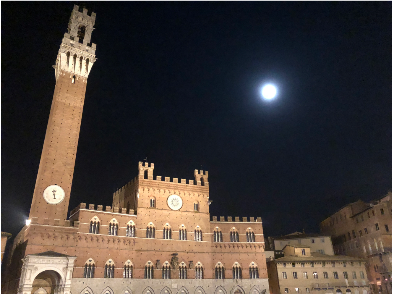
Piazza del Campo di sera