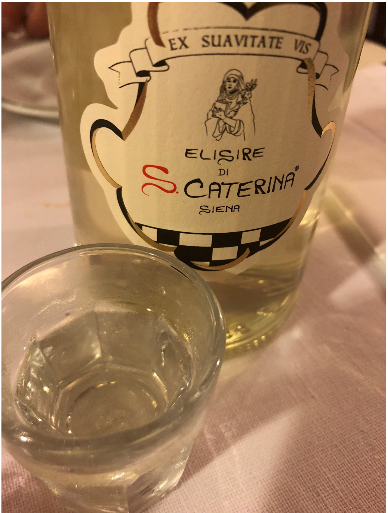
Elisir di Santa Caterina

Siena, una città ricca di leggende, di arte e di storia, che ancora una volta mi ha portato a pensare a quanto sia bella