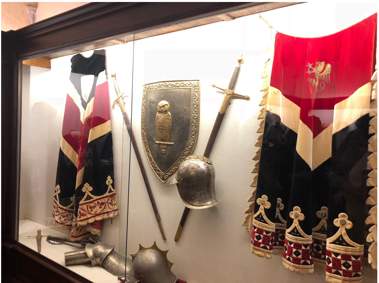
Museo Contrada della Civetta

Non mi soffermerò sul Palio, una corsa di cavalli condotta da fantini mercenari, che sia pur di secolare tradizione, ogni anno scalda l’atmosfera al punto da creare eccessi e talvolta incidenti, per tutti gli esseri coinvolti, umani e animali.