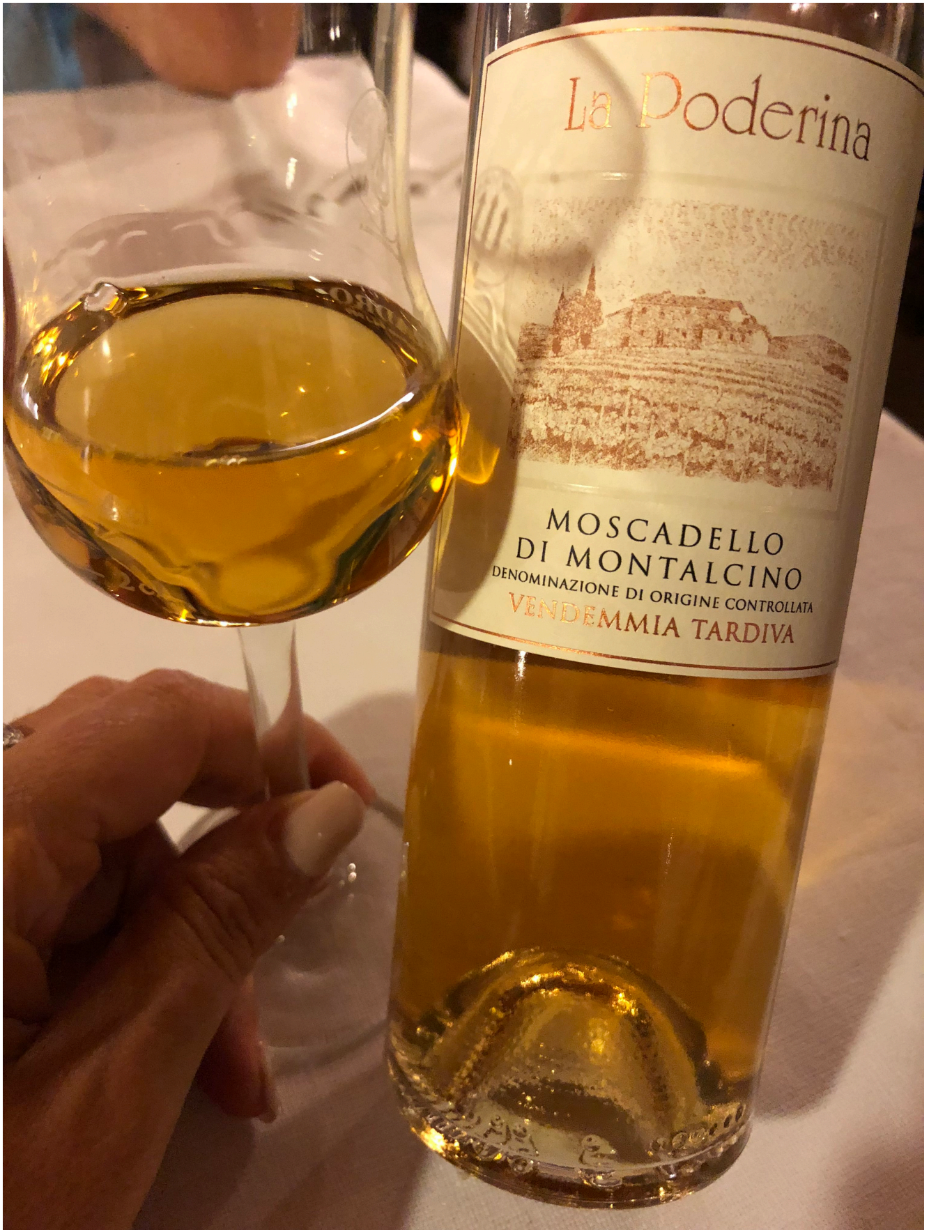
Moscadello di Montalcino