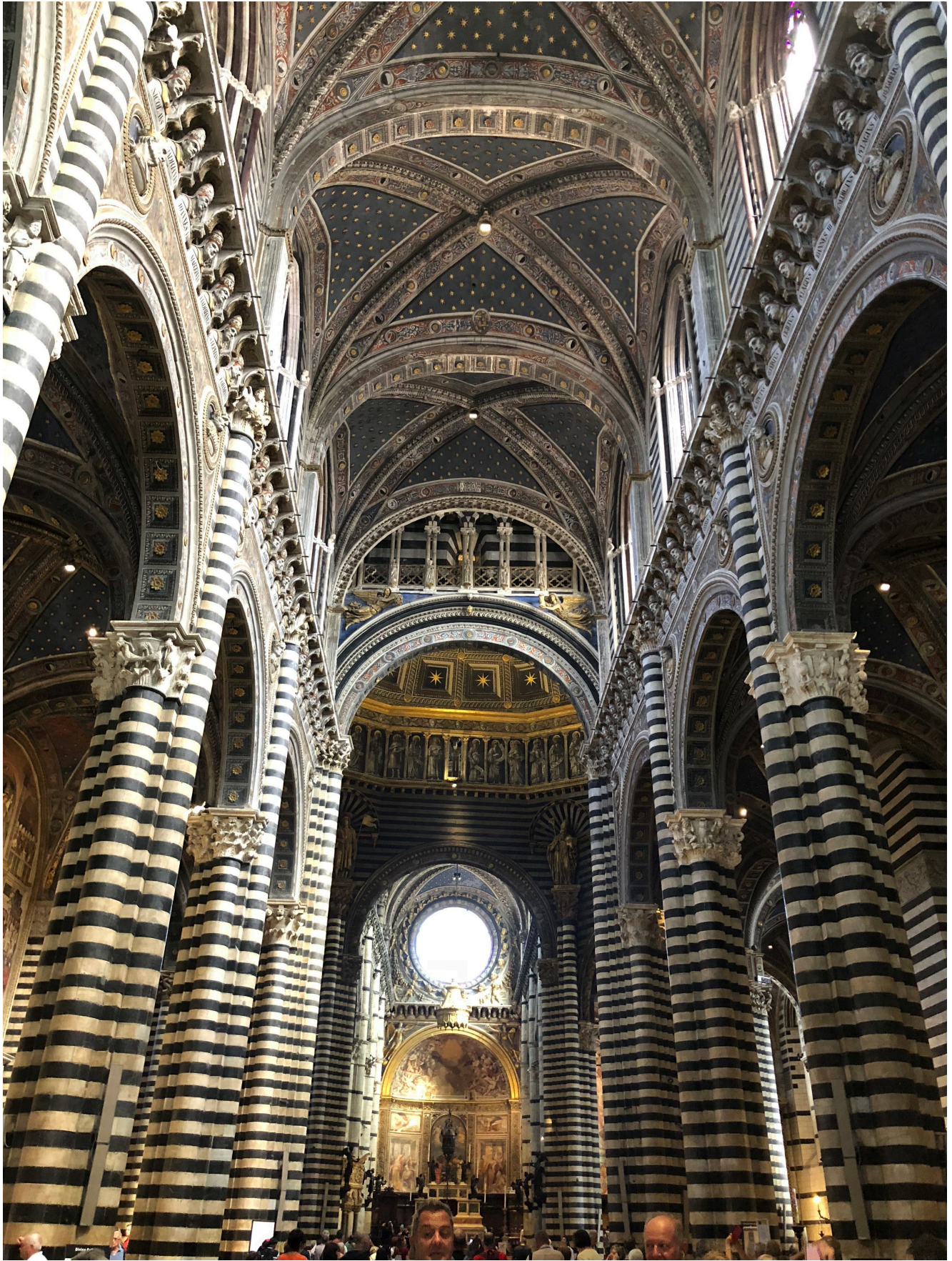
Cattedrale dell'Assunta – interni