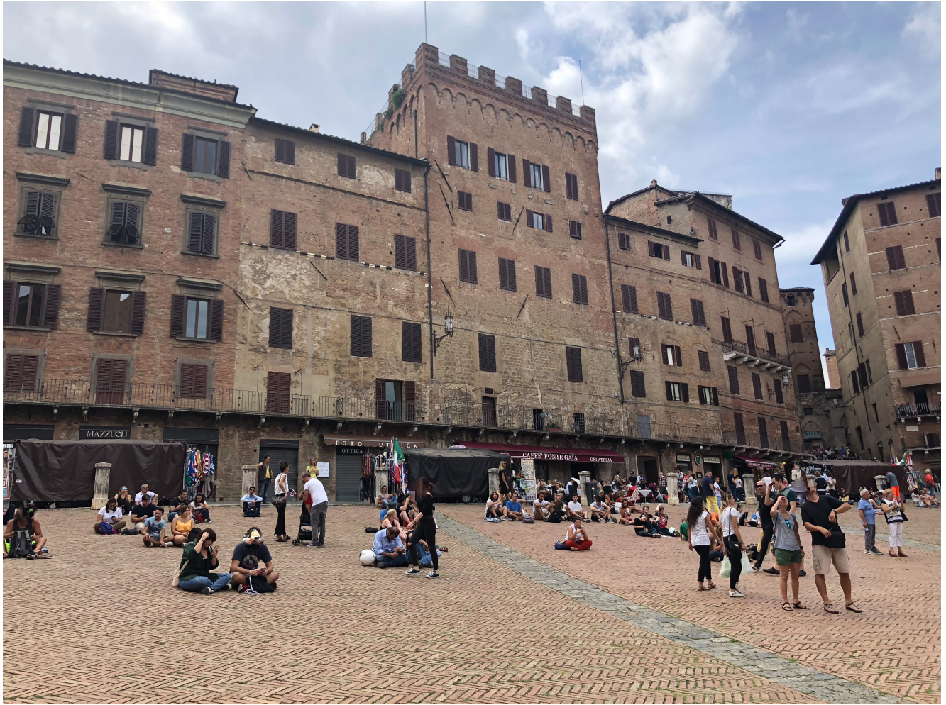
Piazza del Campo