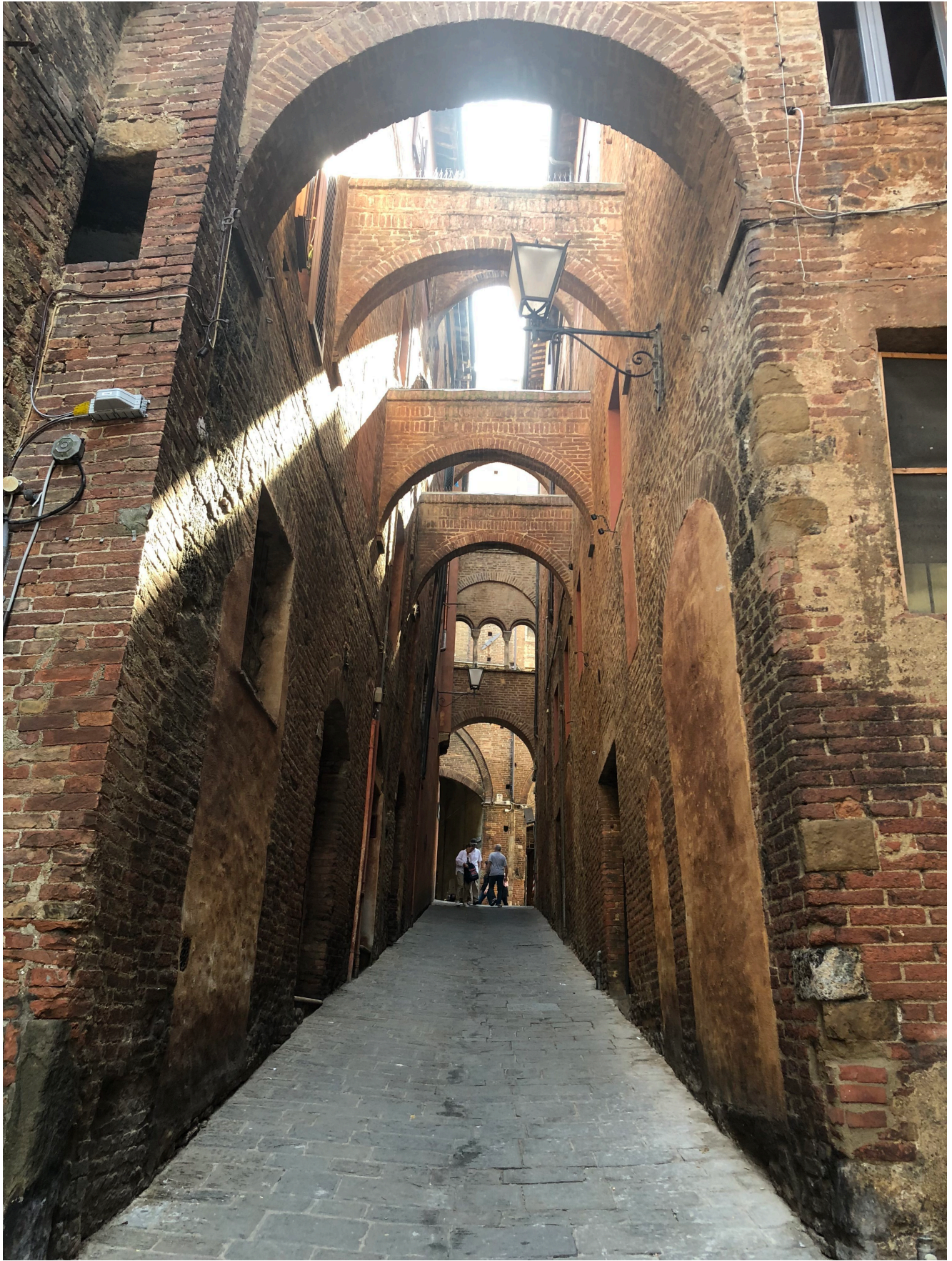
Passeggiando per Siena