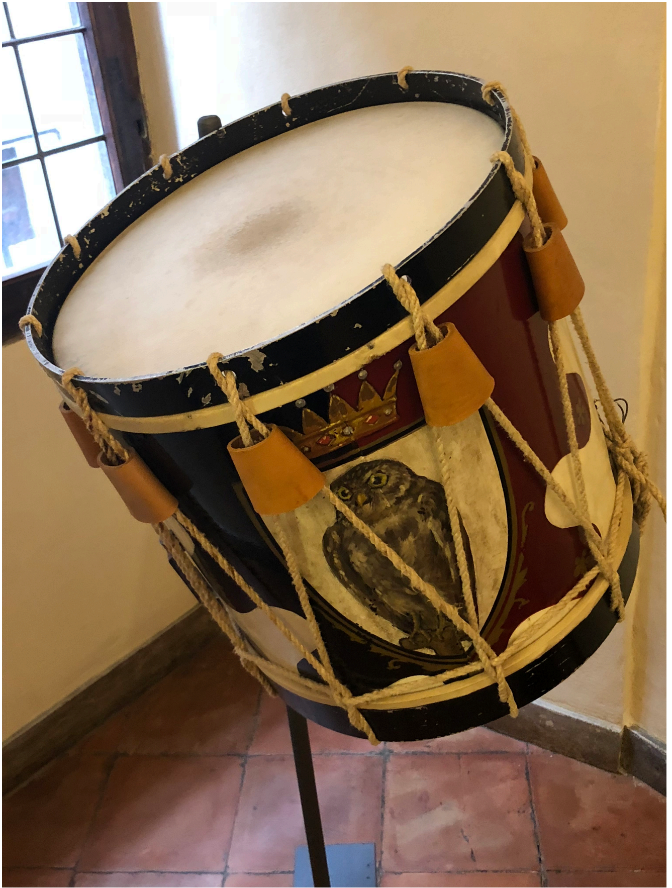
Museo Contrada della Civetta