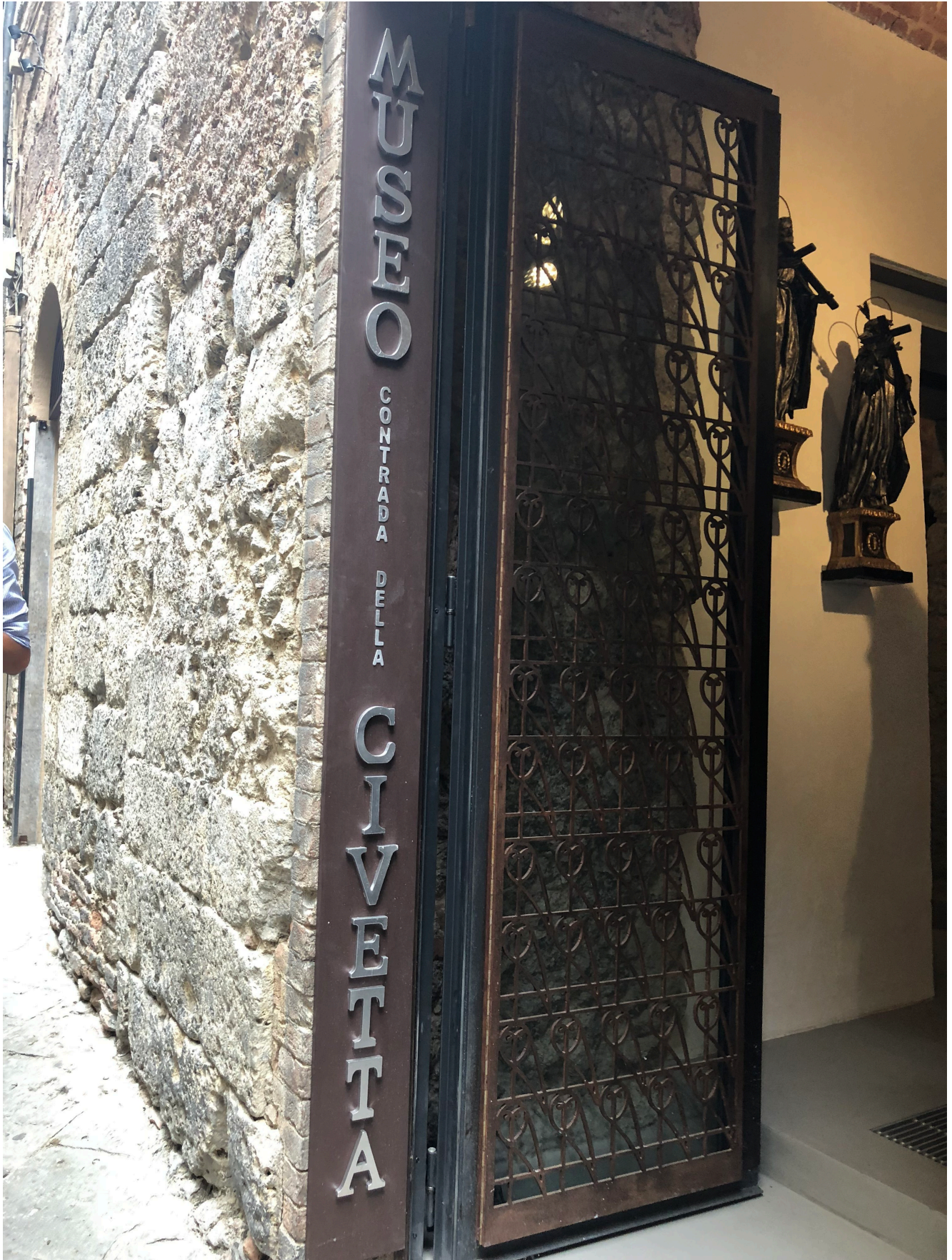
Museo Contrada della Civetta

A questo proposito riporto un pensiero del grande Federico Fellini.