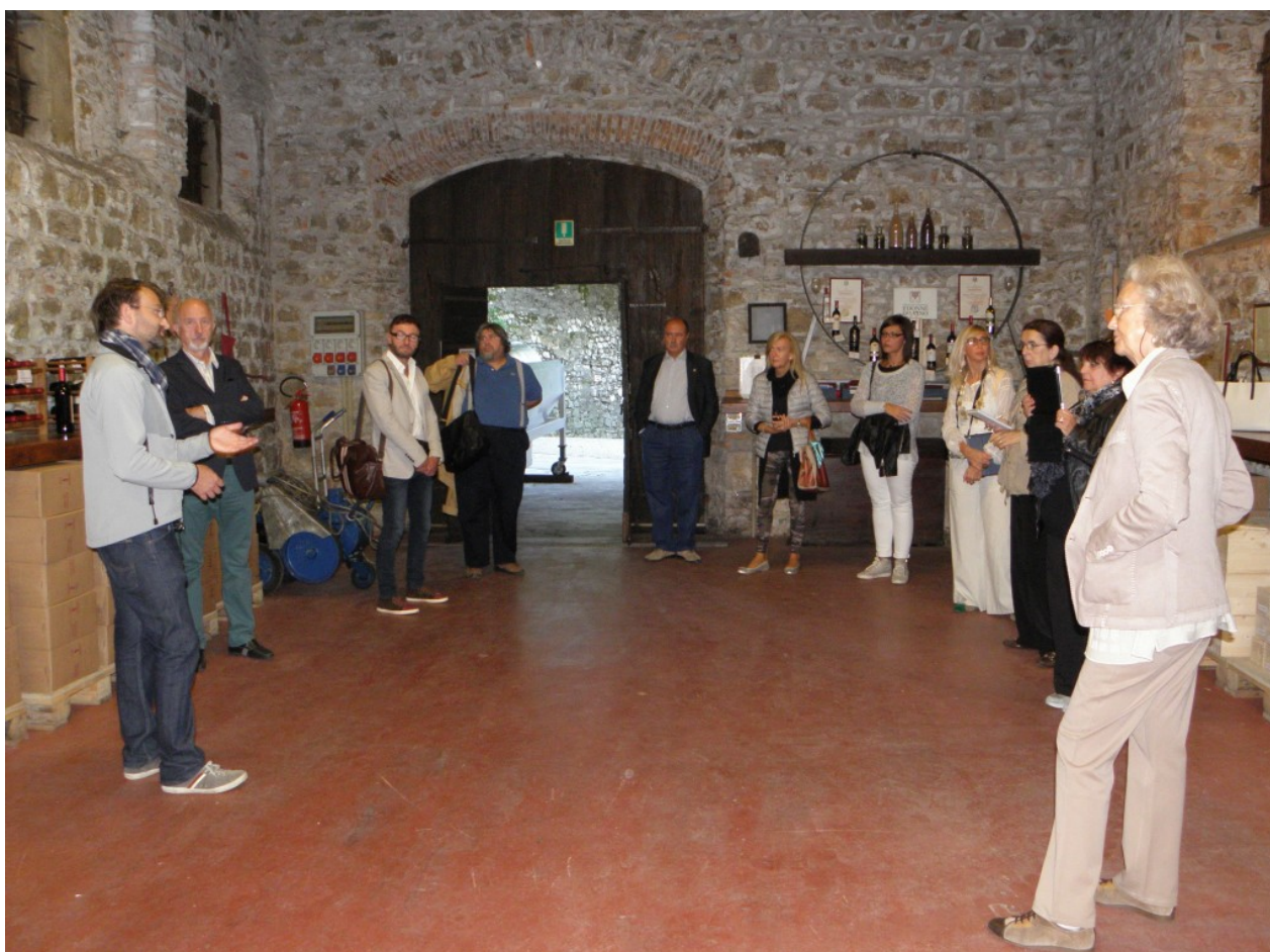
Tour press dedicato alla viticoltura in Valcalepio

Per quanto riguarda il Valcalepio Moscato Passito Doc ottenuto da uve di Moscato di Scanzo, vitigno autoctono della bergamasca, la produzione di questa stagione anomala farà capire le scelte "di qualità" che si prefiggono i .produttori della zona