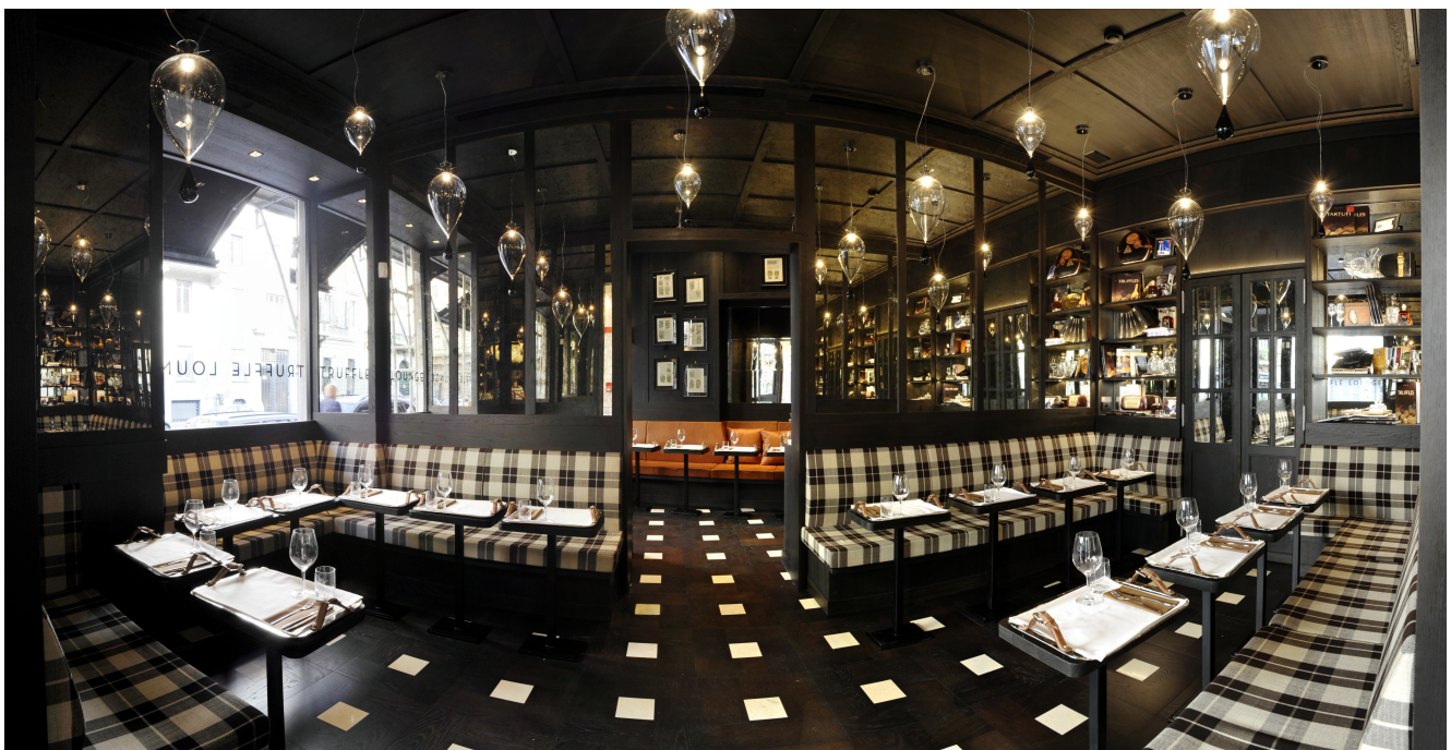
Tartufi & Friends Lounge

Corso Venezia, 18 – Milano www.tartufiandfriends.it