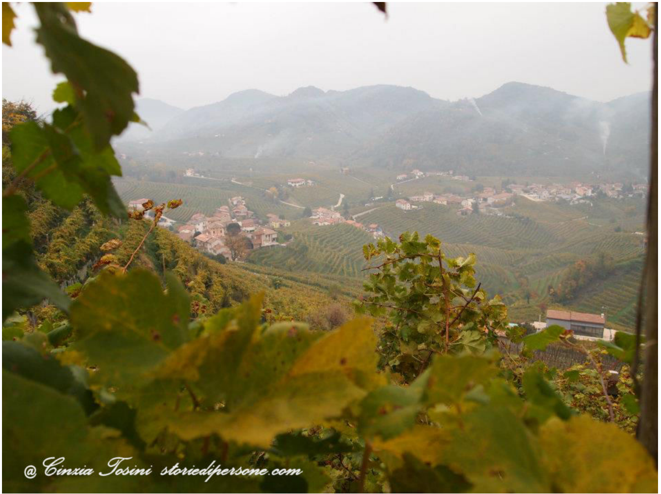
Valdobbiadene in Autunno